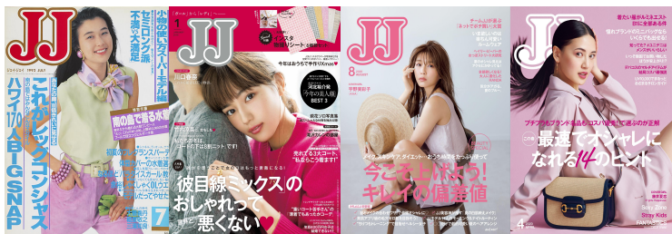
歴史あるファッションメディア『JJ』が主催のオーディション！

マシェバライベントページ： https://www.mache.tv/event/jgirl2025/detail/