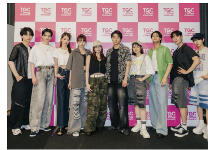
JJが主催するイベントなどで1年間「J-GIRL」として活動！